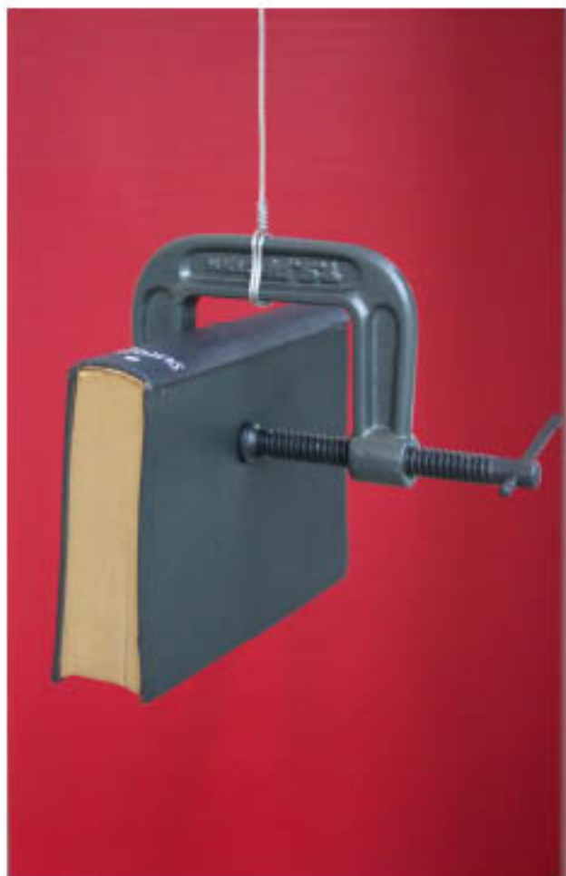
JUAN FERNANDO MORALES (Puerto Rico/New York) Colgao, 2012 Installation, Variable dimensions